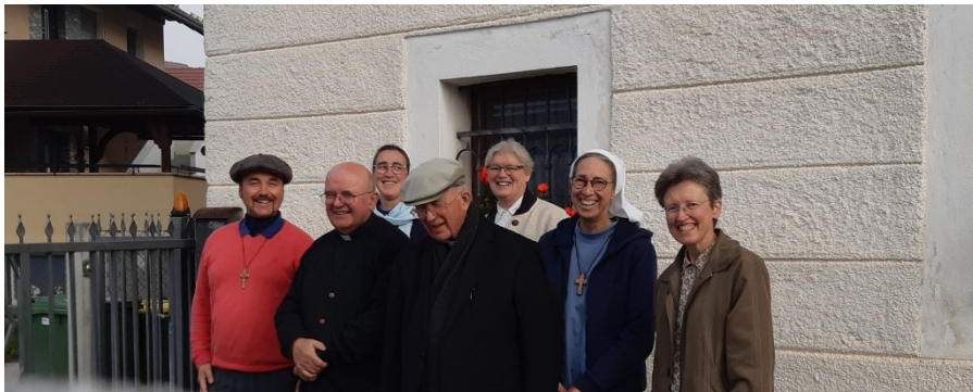
Onderweg naar Medjugorje bij de Zusters van Het Werk in Slovenië