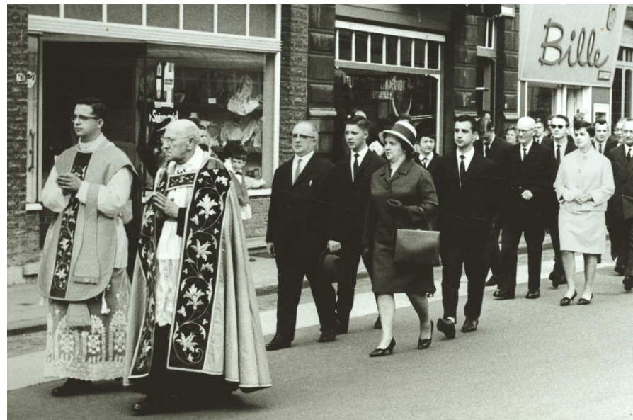
De stoet op weg naar de Eremis zondag 19 juli 1964

De volgende zondag, 19 juli, droeg hij zijn Eremis op in een bomvolle St.-Franciscuskerk te Menen, zijn parochiekerk.