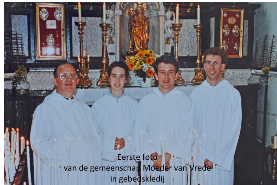
Eerste foto van de gemeenschap Moeder van Vrede in gebedskledij